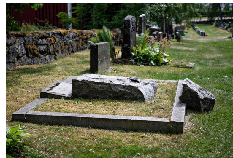
Kaatunut muistomerkki. En gravvård som fallit.